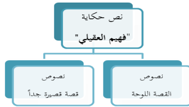
(الرسم البياني رقم ٣)

و"حلقة القصص القصيرة" التي يتكون منها نص "حكاية فهم العقيلي" نجدها يتشظي إلى مجموعة من القصص؛ منها القصة اللوحة وعددها خمسة نصوص وأخذت الأرقام التالية؛ ١٩، ٣٢، ٣٥، ٣٠، ١، والقصة القصيرة جداً وعددها أحد عشر نصاً وأخذت الأرقام التالية: ٣٠، ٢٧، ٢٥، ٢٣، ٢١، ١٧، ١٥، ١٣، ١١، ٩، ٧. ويمكن تفصيل ذلك التشظي لنص "حكاية فهم العقيلي" كالآتي: