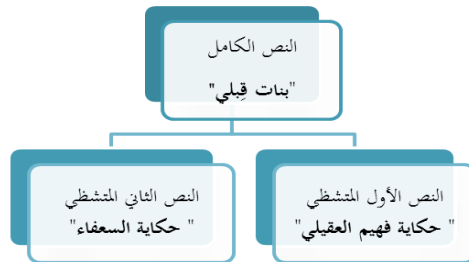
(الرسم البياني رقم ١)

ومن القراءة الأولى لهذه الرواية نجد أن بنيتها اعتمدت على فكرة تشظي النص الرئيس فمن المتعارف عليه أنّ النص الروائي التقليدي عبارة عن بنية واحدة يكون متسلسلاً في السرد والحكي بطريقة تصاعدية في الأحداث وفي تطوّر شخصيات الرواية، لكن في رواية "بنات قبلي" نجد عبارة عن نص واحد تشظّي إلى عدد من النصوص القصصية المتنوعة أو أنه عبارة عن مجموعة من النصوص التي جمعها المؤلف بشكل جعلها تبدو كقصص حكاية حاول أن يربّتها وكأنها لعبة سردية يلعب بها القارئ، فيحكي عن شخصية في شكل قصصي ثم يعود لروايته الرئيسة ثم يعود لحكي موقف آخر عن شخصية أخرى ثم يعود مرة أخرى إلى روايته الأصلية. وهذه الفكرة في بناء الرواية تدفعنا إلى مناقشة فكرة تداخل الأجناس القصصية المختلفة داخل النص الرئيس/ الكامل. ومن ثم نجد أن بنية النص الكامل للرواية "بنات قبلي" يتكون من ٣٢ مقطعاً في حقيقته عبارة عن نصّين رئيسيين، سوف نطلق على النص الأول المتشظي اسم "حكاية فهيم العقيلي" وعلى النص الثاني المتشظي سوف نطلق عليه اسم "حكاية السعفاء"، ويمكن توضيح ذلك من خلال الشكل البياني التالي: